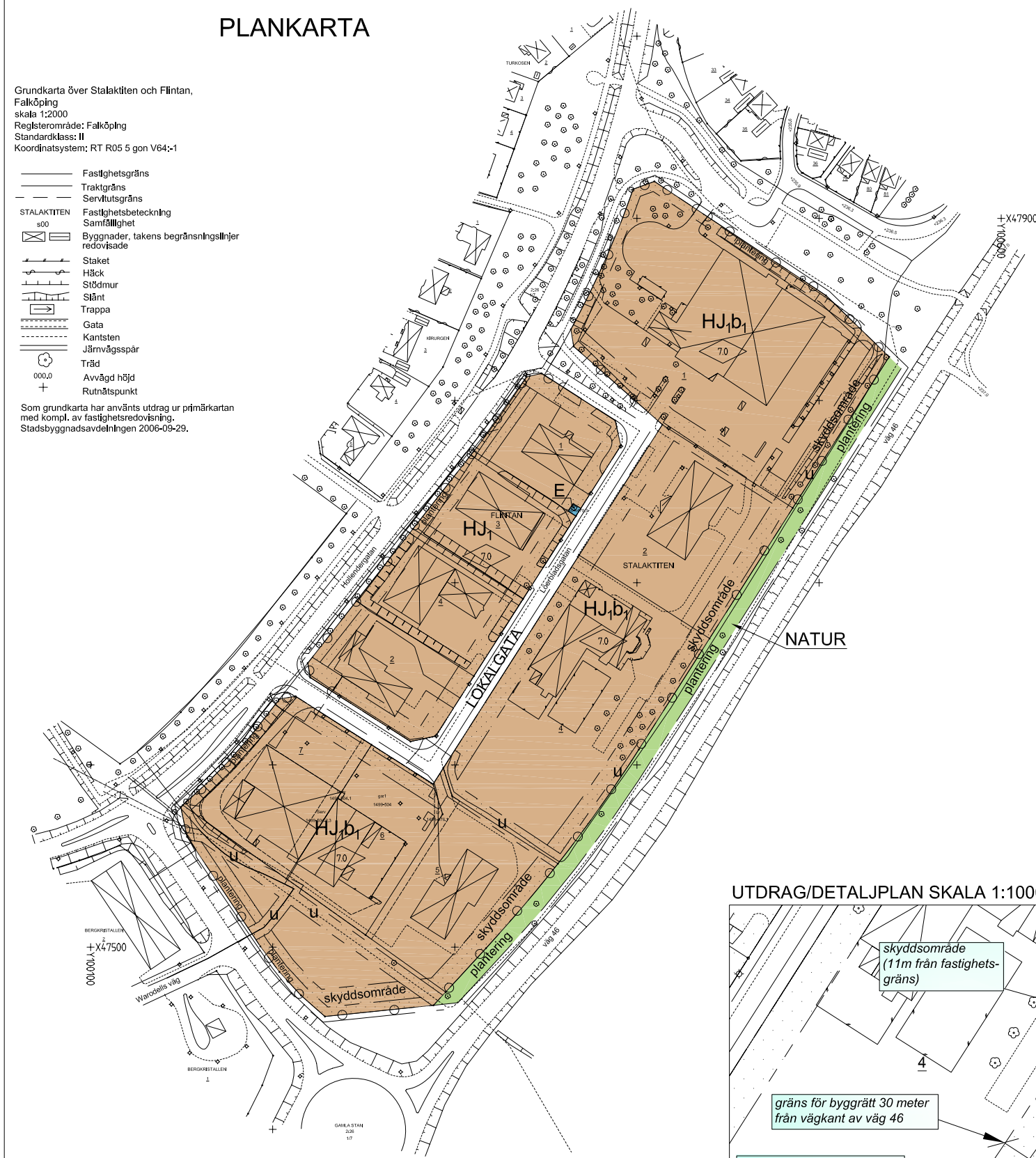
UTDRAG/DETALJPLAN SKALA 1:1000

Som grundkarta har använts utdrag ur primärkartan med kompl. av fastighetsredovisning. Stadsbyggnadsavdelningen 2006-09-29.