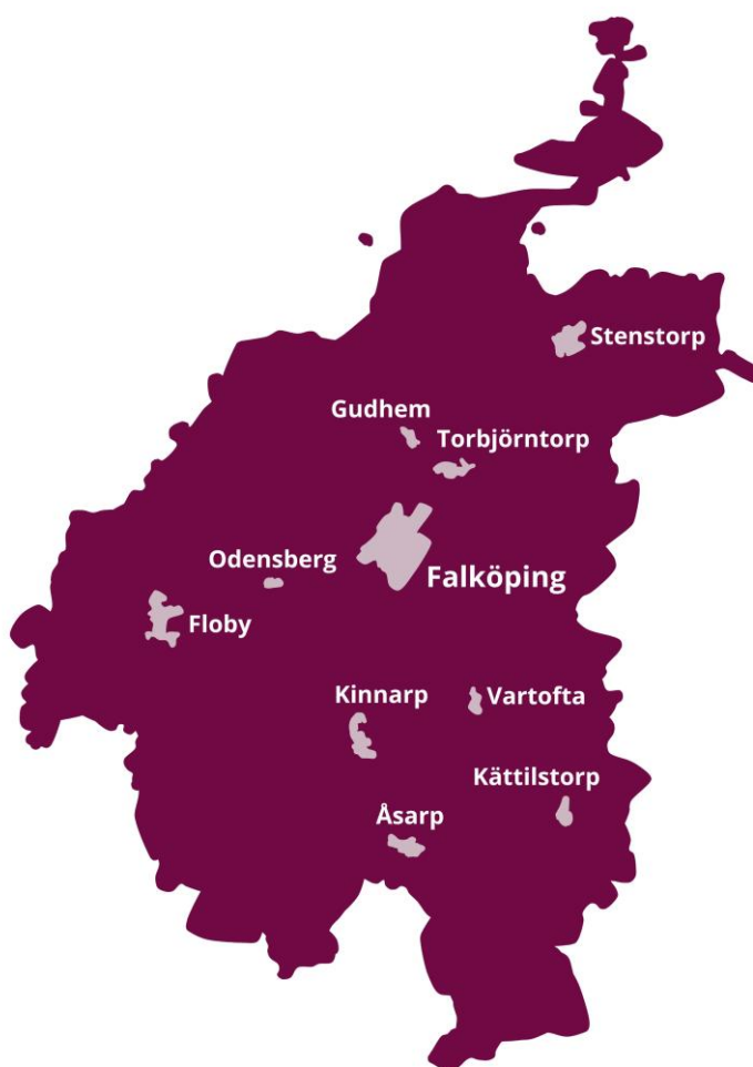
Karta över Falköpings kommun och dess nio största landsbygdsorter.

Samtidigt finns utmaningar. Många orter vill växa, men utvecklingen ska ske med respekt för naturen och det är ofta svårt att finansiera nybyggnation. Flera små lanthandlare har lagts ner medan andra har ersatts av obemannade butiker. Vägnätet har försämrats på vissa håll, och bussturerna har blivit färre. För flera på landsbygden kan avståndet till Falköpings stad ibland upplevas längre än vad kartan visar.