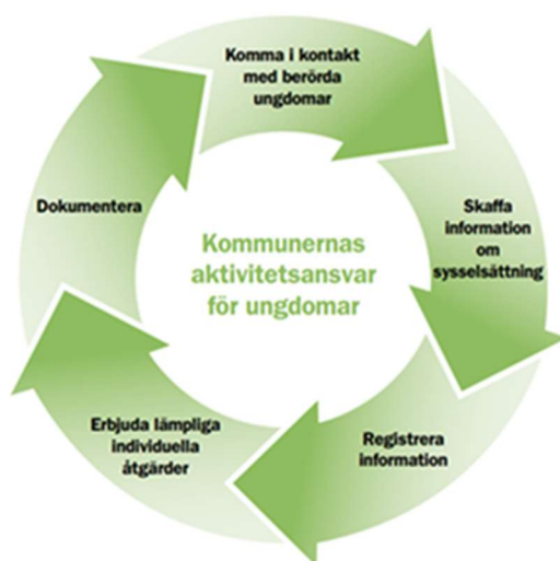
Fig. 1 Kommunernas aktivitetsansvar för ungdomar löper under hela året.