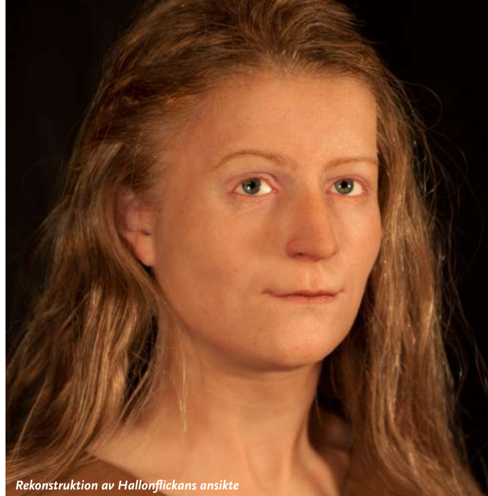
Rekonstruktion av Hallonflickans ansikte

0515-88 50 50 · museet@falkoping.se · www.falkoping.se/museet